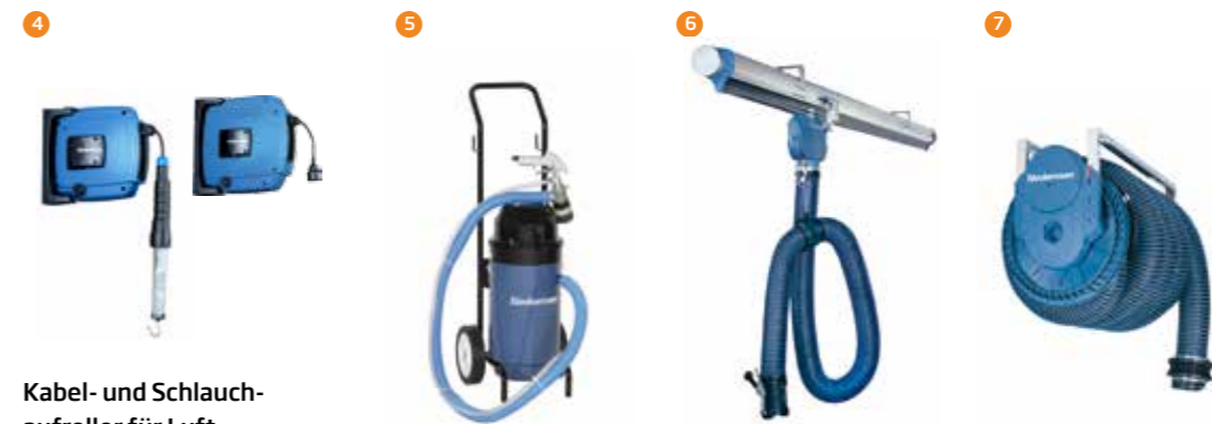
4 Kabel- und Schlauch- aufroller für Luft, Wasser, Gas, Öl usw. – einfach zu bedienen und sicher in der Anwendung.