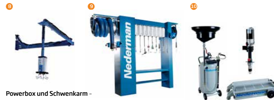
8 Powerbox und Schwenkarm – Rationalisierung der Arbeitsabläufe und Verbesserung der Ergonomie mit Anschlüssen für Druckluft, Vakuum und Strom in großflächigen Arbeitsbereichen.