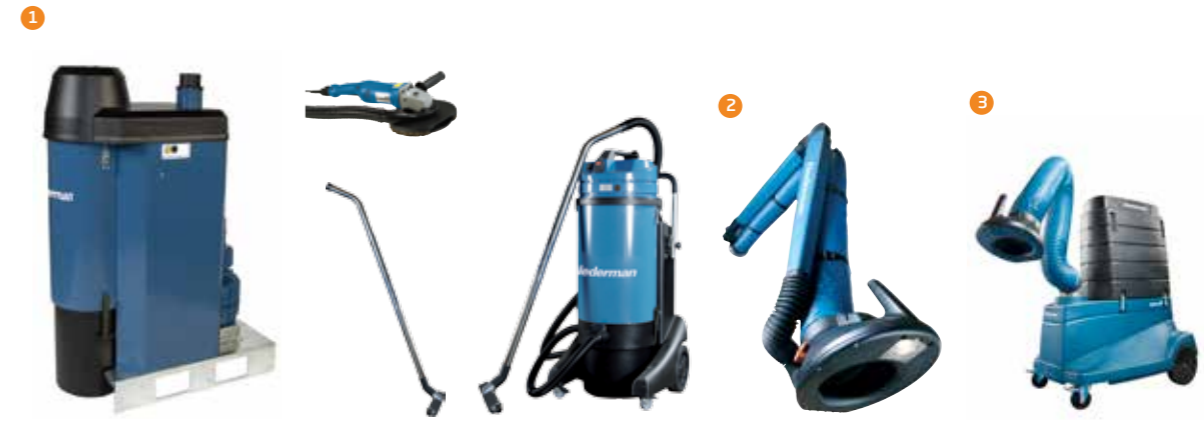
1 Absaugung von Schweißrauch, Staub und Partikel – Absaug- und Filtersysteme auf Grundlage von Hoch- und Niedervakuumverfahren. Erhältlich als zentrale Systeme, zum Bedienen von mehreren Entnahmestellen, oder als Mobilgeräte, zur flexiblen Nutzung.