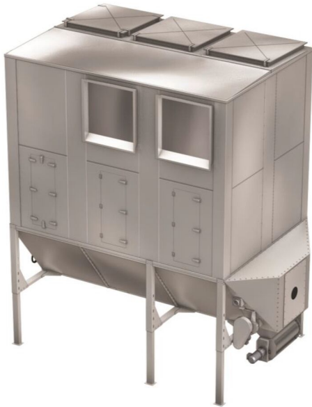
Example: NFKZ3000 2+1 HJ filter with side and top venting for St2 dust

Schlauchfilter für große Luftmengen mit hoher Materialbelastung.