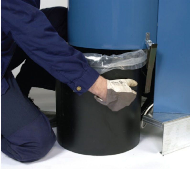
The plastic bin liner is easy to change