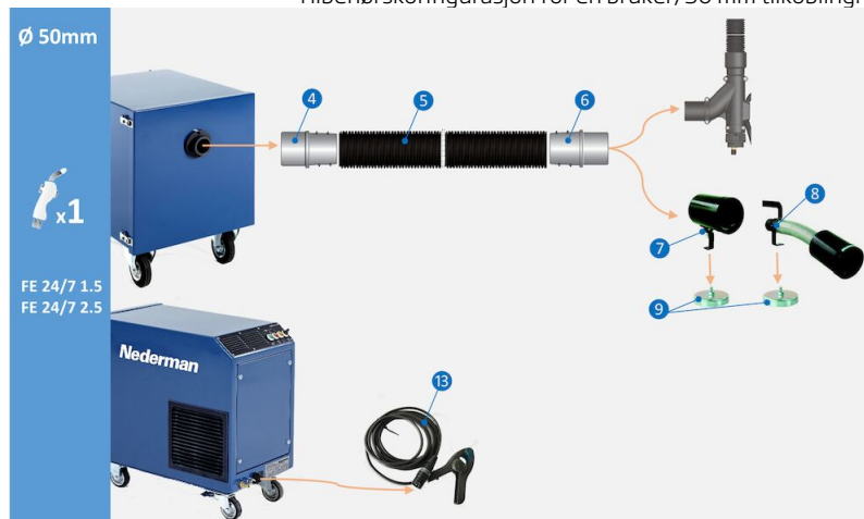
Tilbehørskonfigurasjon for én bruker, 50 mm tilkobling:

Tilbehørskonfigurasjon for én bruker, 50mm sveiseapparattilkobling. (4) Slangekobling M50-50P, art.nr. 55999416 (5) Slange PE-51 L=5 m, art.nr. 55999412 (6) Slangekobling F50-50P, art.nr. 55999417 (7) Munnstykke CWN-S 105/50 lyddemper, art.nr. 55999415 (8) Munnstykke CWN-S 105/50L lyddemper, art.nr. 55999414 (9) Magnetisk fot for munnstykke CWN-S, art.nr. 55999419 (13) Sensorklemme med plugg for automatisk start/stopp, art.nr. 55999410