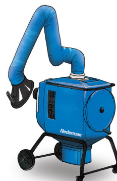
FilterBox 10 eQ Denne ergonomiske enheten er den mest avanserte for bruksområder med lite til middels støv og røyk