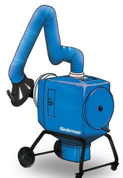
FilterBox 12 M En kostnadseffektiv enhet med manuell filterrengjøring og kraftig vifte for tynge bruksområder