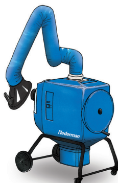
FilterBox 10 M En kostnadseffektiv enhet, med manuell filterrengjøring for bruksområder med lite til middels støv og røyk