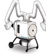
FilterBox Hygiene Twin