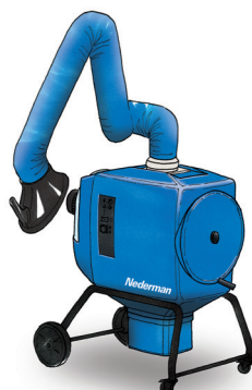
FilterBox 10 A Med automatisk filterrengjøring for bruksområder med lite til middels støv og røyk