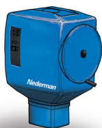
FilterBox Wall Veelzijdige unit zonder afzuigarm voor aansluiting op externe ventilator