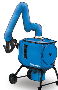
FilterBox 10 eQ Hoogwaardige ergonomische unit voor lichte tot middelzware stof- en rooktoepassingen