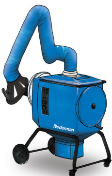
FilterBox 12 eQ Hoogwaardige ergonomische unit voor zwaardere stof- en rooktoepassingen