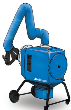
FilterBox 12 A Unit met automatische filterreiniging voor zwaardere stof- en rooktoepassingen

Internationale gezondheidsorganisaties erkennen het belang van het voorkomen van gezondheidsrisico's die gepaard gaan met het vrijkomen van dampen en rook tijdens het lassen. In vele landen zijn strenge normen vastgelegd om de toegestane blootstellingsgrens (PEL) te beperken. Lasrook kan ook gevoelige machines zoals robots beschadigen. FilterBox is ook geschikt voor lasrook dat vrijkomt bij het lassen van RVS (chromiumgehalte >30%) en voldoet aan de OSHA-eisen voor chroom (VI).